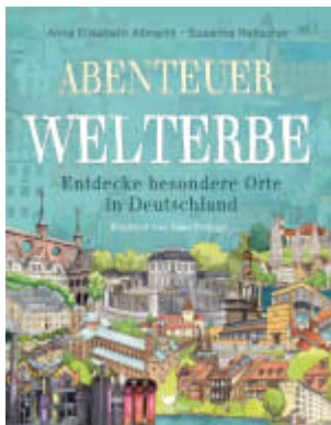
Abenteuer Welterbe - Entdecke besondere Orte in Deutschland