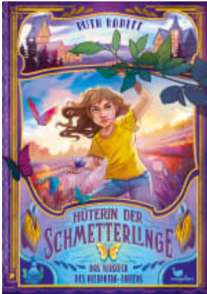
Hüterin der Schmetterlinge - Das Versteck des Kleopatra- Falters (Band 1)