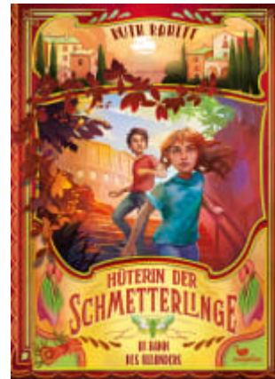
Hüterin der Schmetterlinge - Im Bann des Oleanders (Band 3)