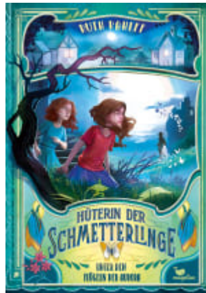
Hüterin der Schmetterlinge - Unter den Flügeln der Aurora (Band 2)