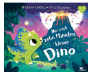
Nur noch zehn Minuten, kleiner Dino