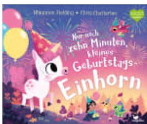
Nur noch zehn Minuten, kleines Geburtstags-Einhorn