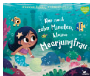
Nur noch zehn Minuten, kleine Meerjungfrau