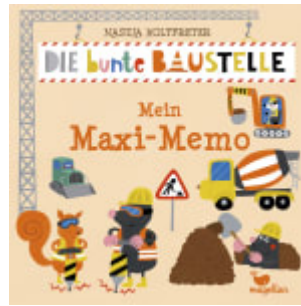
Die bunte Baustelle - Mein Maxi-Memo