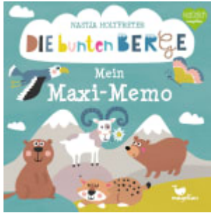
Die bunten Berge - Mein Maxi-Memo