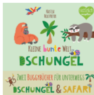
Kleine bunte Welt - Dschungel & Safari