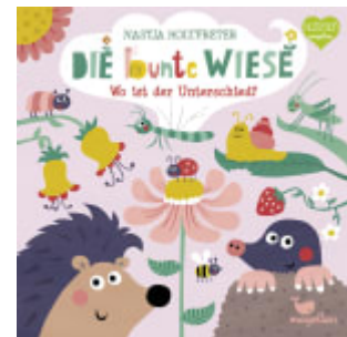
Die bunte Wiese - Wo ist der Unterschied?