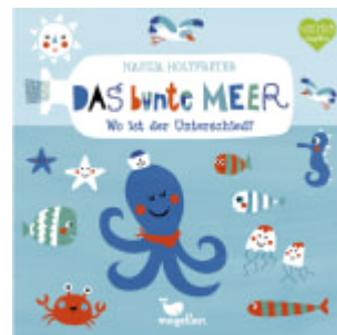
Das bunte Meer - Wo ist der Unterschied?