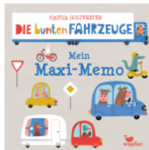
Die bunten Fahrzeuge - Mein Maxi-Memo