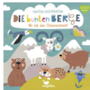
Die bunten Berge - Wo ist der Unterschied?