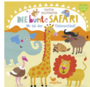
Die bunte Safari - Wo ist der Unterschied?