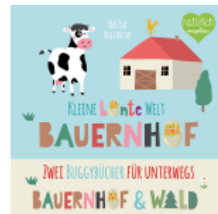
Kleine bunte Welt - Bauernhof & Wald