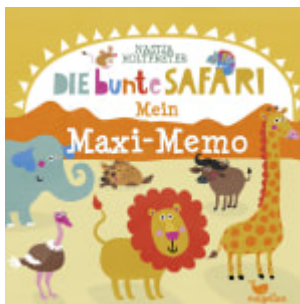
Die bunte Safari - Mein Maxi-Memo