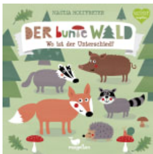
Der bunte Wald - Wo ist der Unterschied?