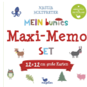
Mein buntes Maxi-Memo-Set