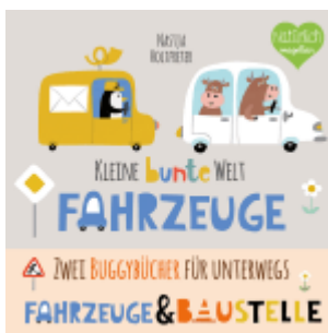
Kleine bunte Welt - Fahrzeuge & Baustelle