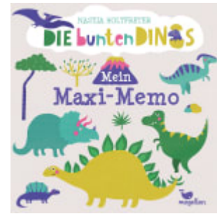
Die bunten Dinos - Mein Maxi-Memo