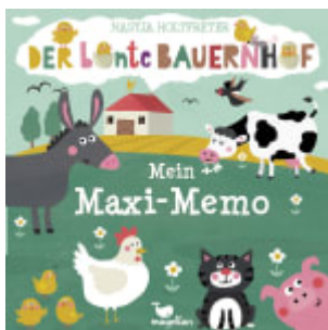
Der bunte Bauernhof - Mein Maxi-Memo