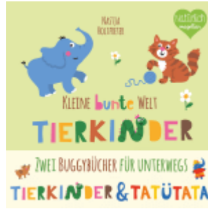
Kleine bunte Welt - Tierkinder & Tatütata