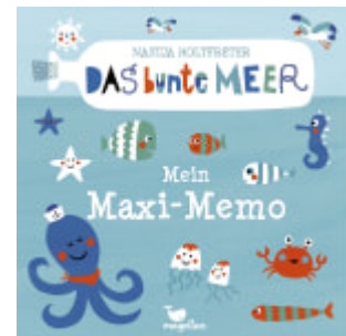
Das bunte Meer - Mein Maxi- Memo