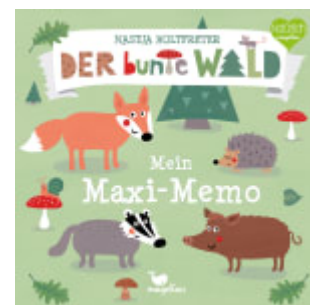
Der bunte Wald - Mein Maxi-Memo