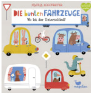
Die bunten Fahrzeuge - Wo ist der Unterschied?