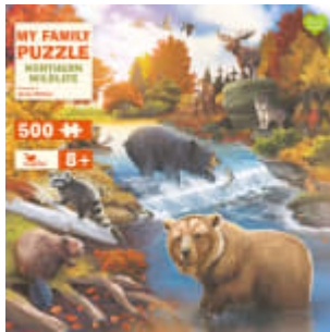
My Family Puzzle - Northern Wildlife