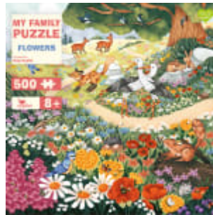
My Family Puzzle - Flowers