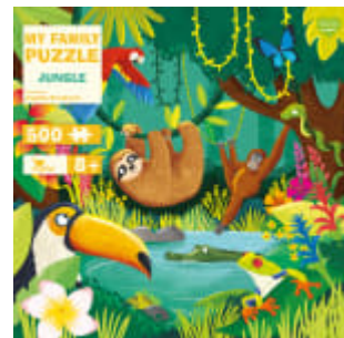
My Family Puzzle - Jungle