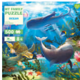
My Family Puzzle - Ocean